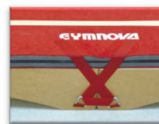
Bandes auto-agrippantes et pions métalliques