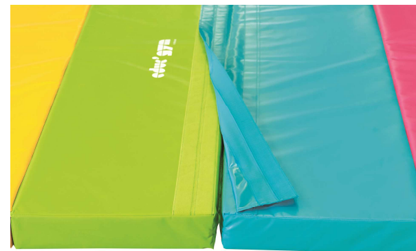
Liaison des tapis par bandes auto-agrippantes