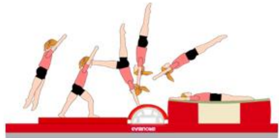
Travail du deuxième envoi de la lune