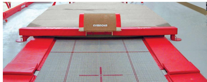
Réf. 3497 - L'appel s'effectue sur le trampoline et la réception en fosse.

Escamotable latéralement, il se verrouille et de se déverrouille instantanément.