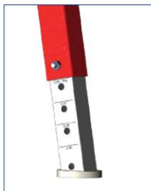
Pieds réglables en hauteur