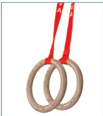
Anneaux en bois multiplis