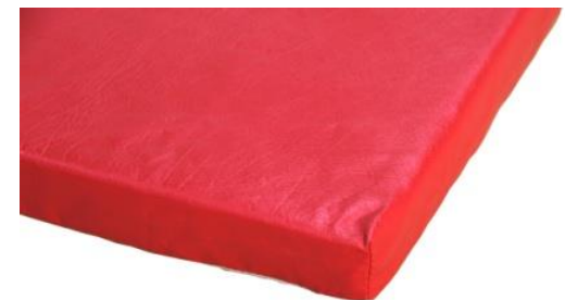
Sans coins renforcés