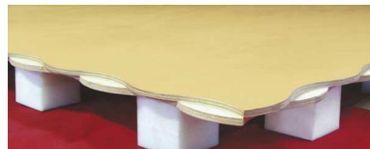
Detalle de las placas con borde ondulado